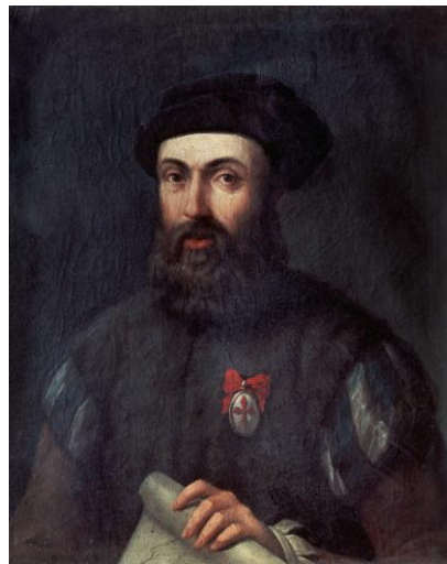
Fernando de Magallanes