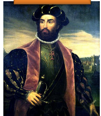
Vasco de Gama