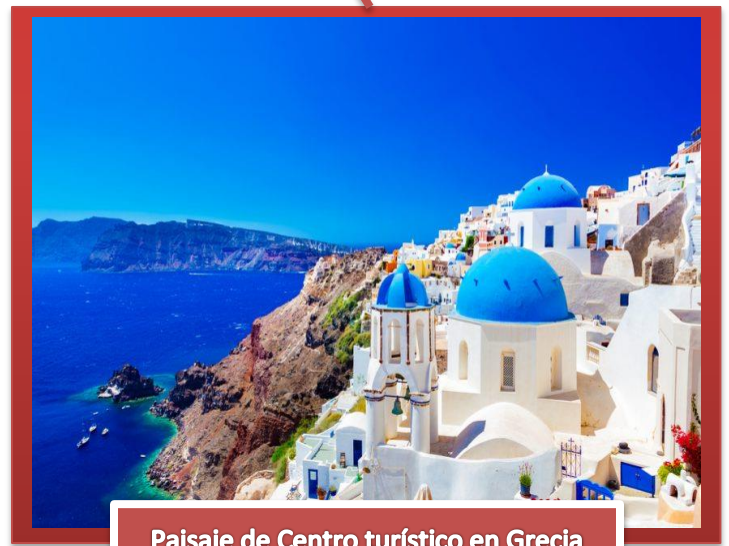
Paisaje de Centro turístico en Grecia